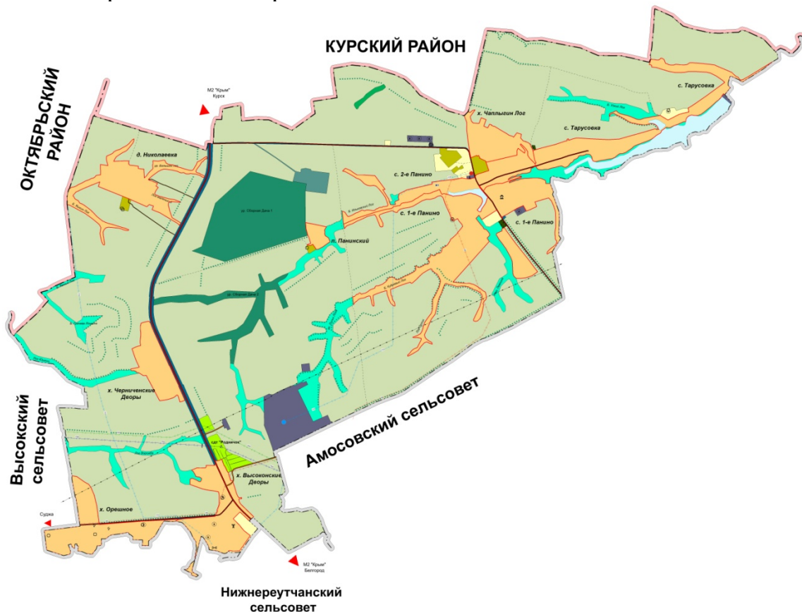
Рис. Существующие границы муниципального образования Панинский сельсовет.

Общая площадь земель в границах муниципального образования «Панинский сельсовет» составляет 67,63 кв. км. (6 % территории Медвенского района). Социально-экономическая активность сосредоточена в административном центре сельсовета.